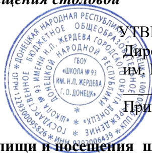
График посещения столовой